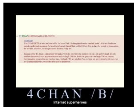
Суть /b/, оригинал.

Захватили школу в Беслане, а мы смеёмся. Подростки подожгли сверстника за отказ дать денег, а мы смеёмся. Три школьницы прыгнули с крыши 16-ти этажного дома, взявшись за руки, а мы смеёмся и просим ещё. Самоубийства, убийства, геноцид — мы смеёмся. Расизм, сексизм, дискриминация, ксенофобия, изнасилования — мы смеёмся. Мы бездушно подпишемся под чем угодно, наши предпочтения не основаны на здравом смысле, бесцельные споры — наша стихия, мы — истинное лицо интернета. Мы — Анонимус . Мы не прощаем. И имя нам — легион.