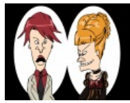
Umineko no naku koro ni PSG