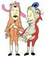
Шоу Рена и Стимпи