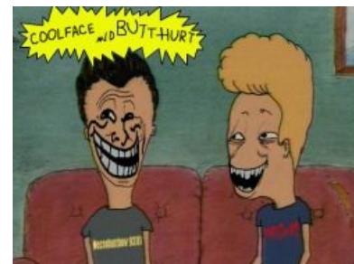
Баттхед и Бивис

Телевизор — главный неживой «персонаж» мультесериала, появляющийся почти в каждой серии. Если считать его персонажем, то будет, пожалуй, третьим по частоте появления в мультесериале. ИЧСХ, примерно в половине серий является «зачинщиком» событий и ещё в 1/4 меняет поворот сюжета. Неоднократно подвергался побиванию со стороны хозяев. Подменяет родителей двух героев в плане воспитательной функции — многие черты характера В&В определены героями клипов/передач. Основная функция — показ музыкальных видеоклипов главным героям. Также является свидетелем и основной причиной драк.