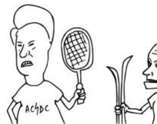
Баттхед и Бивис в политике этой страны