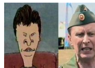
IRL, 10 лет спустя