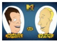
Медведев и Путин