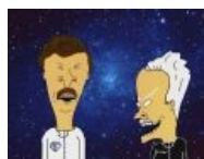
Тесла и Эйнштейн