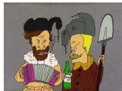
В этой стране

Все помыслы и действия главных героев направлены на удовлетворение своих низменных потребностей — жрать , срать , ржать и смотреть