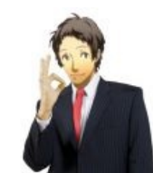
Адати говорит: «маладца!»