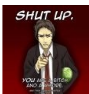
ЗАТКНИСЬ СУКА Advice Adachi