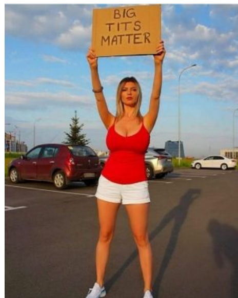
Кошерная пародия на лозунг

С одной стороны, сей движ имеет под собой довольно сильную почву, ведь проблема полицейского насилия в России ничуть не менее актуальна, чем в США. Если абстрагироваться от этой истории, сразу же вспоминаются другие, где менты винтят безобидных студентов во время одиночного пикета разрешённого конституцией этой страны, где менты винтят пенсионеров, вышедших в магазин во время самоизоляции связанной с пандемией коронавируса, где те же менты ломают ноги безобидному хипстеру, копающегося в своём телефоне на акции протеста против путинского беспредела. При этом не стоит делать вид, будто проблема появилась ВНЕЗАПНО и сама собой, она является систематической как минимум на протяжении 20 лет, а то и с 1993 года. Вспомнить хотя бы то, как тех же пенсов крутили в 2004 году во время продвижения монетизации льгот, а так же события в Казанском ОВД «Дальний» в марте 2012 года, породившие такой мем как «Посадить на бутылку», до кучи можно вспомнить ещё станицу Кущёвскую, где на протяжении десяти лет при попустительстве тамошних мусоров творился адовый пиздец в стиле лихих 90-х. Тысячи их! Адекватный ответ ментовскому беспределу был дан приморскими партизанами, но с того момента прошло уже более десяти лет. Дров в топку подбросил и новый Закон о полиции, который делает так же, как в вашей Обамэрике, расширяя как полномочия по досмотру, так и по анальному огораживанию территории и стрельбе в людей.