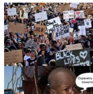
Может показаться диковатым, но текст поста и ответа — изложение сути движения в ядре