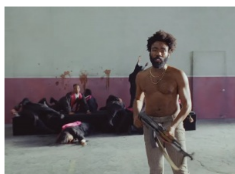
Отсылка в клипе «This is America»

Суд над нашим героем полон лулзов: Руф принципиально отказывался от адвоката и никак не пытался предъявить доказательства в свою защиту, хотя в его доме нашли рукописный манифест , где он срывает покровы и рассказывает свой путь становления белым супремасистом [1] . Кроме того, он отказался от судебно-психиатрической экспертизы и вообще попросил не учитывать его серьёзные психиатрические патологии в следствии, так как считал, что психиатрия — «изобретение жидов» . В качестве адвоката Дилан Руф выступал сам, сознавая со смехом и гордостью, что он — гордый сын своей родины, борющийся с засильем черномазых. Суд явно не оценил порыв спермотоксикозника и в январе 2017 года прописал ему банку егуэцёнки живительную инъекцию, перед которой школоту сурово отпиздил чёрный амбал. Go sry.