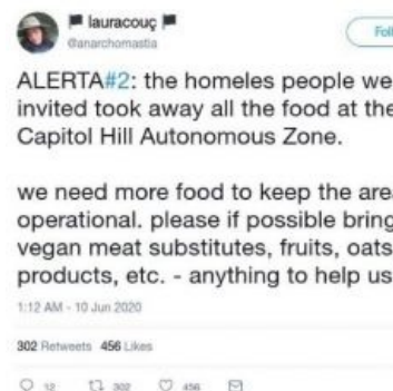
Автономная Зона Капитолийского Холма

18-летняя анархистка-лесбиянка с расовой монобровью, ненавидящая белых, капитализм и цивилизацию, что и основала автономию,