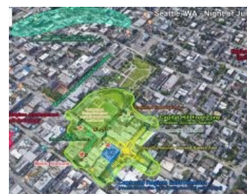
Автономная Зона Капитолийского Холма