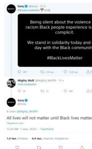
Может показаться диковатым, но текст поста и ответа — изложение сути движения в ядре