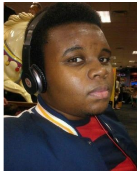
Браун смотрит на тебя, словно на соблазнительно манящую пачку швейцарских сигар