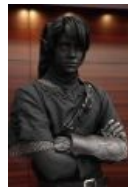
Тоже считается блэкфейсом