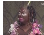
Азиаты знают толк в жирном троллинге