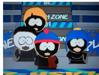
South Park Blackface and Whiteface

Гомосексуальный секс между чёрными Ахиллом и Патроком, всё что вы мечтали увидеть в сериале по Трое.