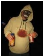
Классический блэкфейс на Хеллоуин, гарантированный и ежегодный срач