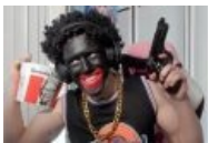
Стример в теме расовых стереотипов