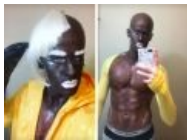
Трансвестит в классическом блэкфейсе