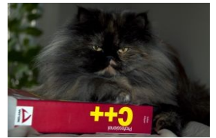
C++ профессионал смотрит на тебя как на...