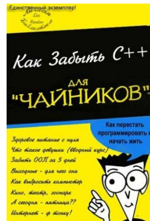
Как забыть C++

Студентами и написано на С++ относительно большое количество программ, а дописывается еще большим количеством индусов. Если системный код Windows написан на С, то свистелки и перделки, вроде IE , шелла, и прочего — чаще всего на С++. Даже мышкой херачить можно: для этого есть Видимая Студия и Борланд Ц-Бидлер. Достаточно знать 15 функций и хорошо манипулировать операторами if и while, и «программный продукт» готов.