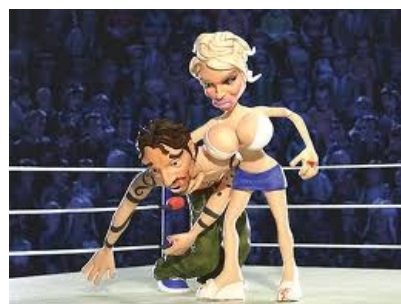
Памела Андерсон и ее оружие.