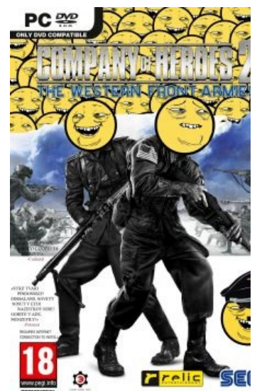
Официальный постер срача дополнения