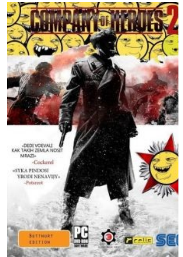
Официальный постер срача