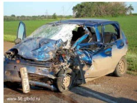
Стоит отдать должное — есть варианты НАМНОГО хуже

В конце 2002 года концерн GM приобрел корпорацию Дэу, и в скором времени все машины, производящиеся в Корее заводом Daewoo на экспорт, стали выпускаться под маркой Chevrolet. В середине 2005 года, после этапа очередного рестайлинга, Daewoo Matiz стал выпускаться и