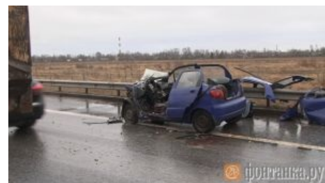
Matiz после столкновения с неподвижным КАМАЗом .