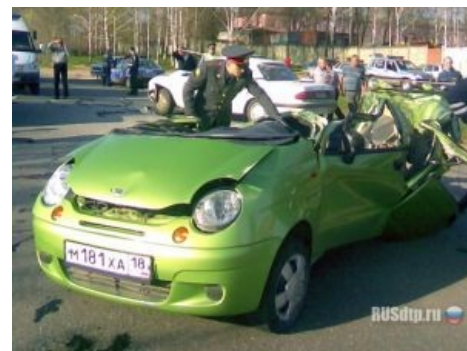
Daewoo Matiz Cabrio

правильного места, чего у большей части водительниц не наблюдается. Укреплённая крыша Дэу Матиз и встроенные в двери силовые балки снижают риск деформации кузова при столкновениях и дают ему столь нужную возможность уничтожить не только бабку с тележкой , но и Камаз, груженный дровами или песком . А по словам сумрачных гениев UZ-Daewoo, специальная конструкция топливного бака предотвращает утечку топлива и его возгорание в случае переворачивания, что многие и проверили на практике ввиду чуть более, чем высокого центра тяжести. Безопасность Матиза подтверждает и краштест Авторевю . Мало того, конструкция настолько хорошо проработана, что её не смогла окончательно испортить даже китайская подделка — она все ещё гораздо лучше любого тазика!