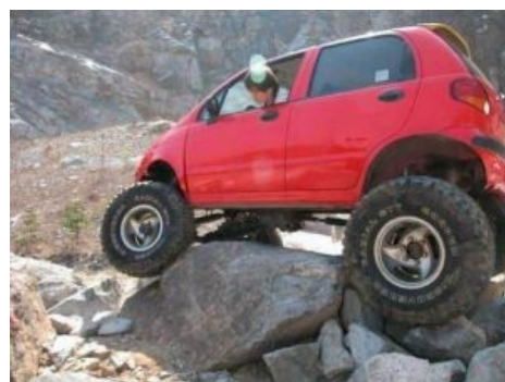
Matiz для дорог этой страны