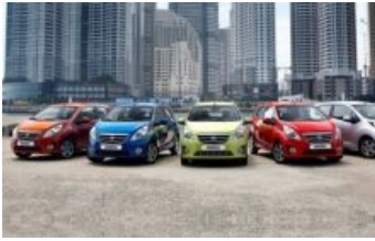
Пока ещё Daewoo