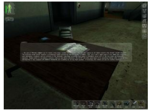
Over 9000. Miles