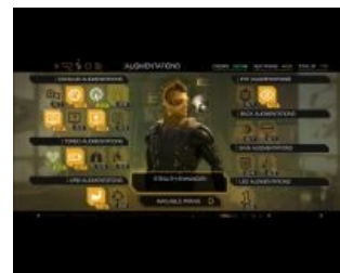
Стальные яйца и прочие аугментации от Sarif Industries