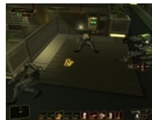
Позабыты хлопоты... Остановлен бег — вкальвают роботы, а не человек. Да, УВЛ! И даже ачивки marksman Спасибо, турелька!

К слову о системе прокачки: скиллов в HR нет, а все улучшения уже установлены в Адама щедрым Сарифом изначально. Соль в том, что из-за предоперационной травмы из .357, мозг поциэнта не может с ними справиться. Выход — либо покупать специальный софт , который заставит мозг работать с выбранными аугментациями, либо долгим и трудным путём ждать, пока мозг разбирается сам по мере получения экспы. В своё время, правда, был баг, позволявший набить сразу два десятка уровней на взломе первого же терминала только вирусами.