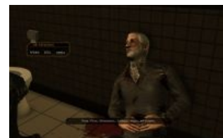
Краткий пересказ статьи

Отдельной и самой, наверное, вкусной «фишкой» Deus Ex были особые умения — «Аугментации»,