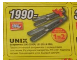
Unix — выпрямитель для руж волос

Аналогичной шуткой среди виндоузятников являются многочисленные замечания про hands.exe ( pryamie_ruki.exe , directhands.dll ), hands.sys ( Номад говорит ruki.sys ) или brain.dll .