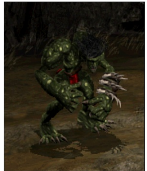
А тролли здесь тонкие...