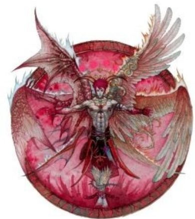
Ипиздемония, как она есть