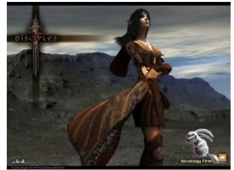
Дисайплс три? Не судьба...

Разработка D3 была довольно мематична, пожалуй, за счет двух феноменов — официального форума, на который каждый день как говно из ушата обрушиваются сотни спама , и тамошнего комьюнити-менеджера с навыками матёрого тролля (ныне списан с борта ), по собственному признанию, ненавидящего оригинальные D1 и D2. А спам теперь сыпется не столько на форум, сколько в приватные форумные инбоксы зарегенных юзверей. Также проект был анонсирован примерно в одно время с 5 героями, но вышли через 3 года после выхода оных и слили им подчистую.