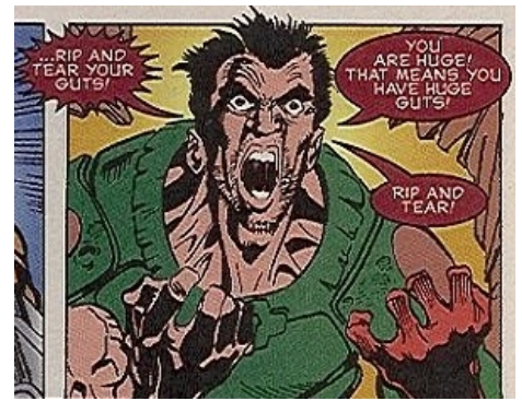
Тот самый комикс

По вселенной Дума было выпущено 4 романа, написанных известными новеллизаторами сериалов Дефидом аб Хью и Бредом Линавивером, из которых два было издано в России. Все четыре являются трешем и эпик фейлами, и единственное, что заставляет дочитать эти быдлокнижки до конца, — это заряд вина , содержащийся в самой вселенной Doom, описанной в них. Впрочем, сии высеры настолько безблагодатны, что даже вселенная игры не вытягивает их ни в коей мере. Дело усугубил прекрасный перевод , выполненный специально обученными надмозгами . Так, вполне понятный pump shotgun превратился в мозголомное « духовое ружьё ». Вот эта тетралогия: