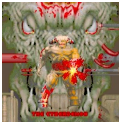
Тот самый кибердемон. Конец Дума : в качестве пасхалки демонстрируются все монстры по очереди.