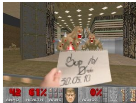
Анон любит Дум

Самый, пожалуй, первый мем. Появился ещё до выхода Doom, когда новости о нём тщательно гуглили (точнее, яхуячили; с гуглом в те времена было несколько напряжённо). Тут-то и выяснилось, что тогдашние поисковые алгоритмы с таким слабовыраженным ключевым словом работают, мягко говоря, не очень. Бедняги находили что угодно про судьбу и рок, кроме новостей о прогрессе игрушки. Тут-то и поступило (ЧСХ примерно за неделю до выпуска) предложение от некоего представителя общественности, мол, называйте следующую игру как-то поконкретнее. Например, «Smashing Pumpkins Into Small Piles Of Putrid Debris». ИДовцы взоржали, общественность тоже взоржала, а idSPISPOPD стало читом прохождения сквозь стены. ЧСХ, во втором Думе этот чит уже выглядел просто как idCLIP.