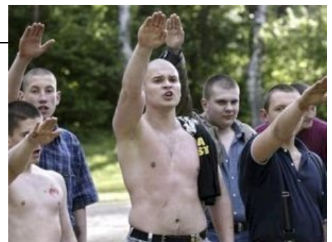
Russian Nazis, lol easy way to troll russians