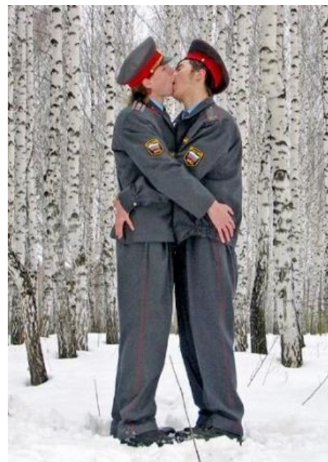
«Typical Russian couple»