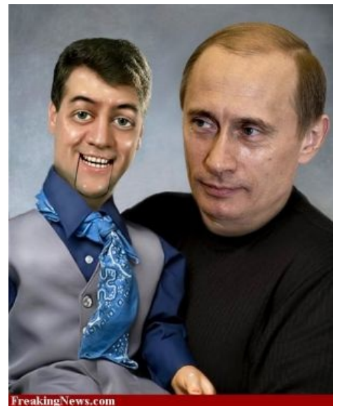
Russia's current president Dmitry Medvedev (your left) with his subordinate Vladimir Putin (your right).

Поддержка Михаила Саакашвили — неплохой способ насладиться драмой на русских форумах. Не забудьте упомянуть, что вы считаете его Гемором и одним из лучших политиков из всех, когда-либо существовавших. Это вызовет такую ярость, что русские будут ломать свои клавиатуры, пытаясь напечатать Вам свой ответ. Когда они начнут говорить, что он — военный преступник, называйте их лицемерами, а военным преступником — Путина. Количество драмы, которое вызовет такая тактика, не поддается никакому описанию, лулзы будут обеспечены очень надолго