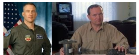
Слева — подполковник Дейл Зелко, пилот того самого несчастного F-117. Справа — полковник Золтан Дани, зенитчик, сбивший тот самый несчастный F-117. Яйца крепче оказались у второго, а с виду и не скажешь