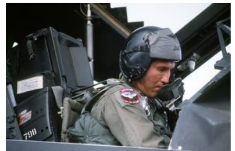
«Бандит» на Хромом гоблине