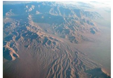
Стелс на фоне пустыни Невада

Однако стелс оставался страшной тайной, только в 1988 году правительство США признало его существование, показав ретушированную фотографию. В апреле 1990 года Пентагон провел публичную демонстрацию «ночного гоблина» всему миру. Публика была в ахуе от одного вида такого чуда, начался бешеный пеар. Стелс замелькал в журналах, на авиасалонах, в фильмах, компьютерных играх и интернетах. И в том же 1990 году выпуск F-117 был прекращен, и деньги, предназначенные на его производство перенаправили на программу Lockheed/Boeing F-22 Raptor (тогда ещё YF-22).