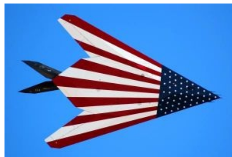
Ымперский пафос пиндосских поцреотов

Для ориентира — стоимость одного Су-27 около 30 млн. USD в экспортном варианте. F-117 на экспорт вообще не поставлялся.