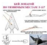
Инструкция для стройбата по уничтожению стелсов