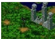
Jungle Strike: F-117 на фоне индейских монументов и РЛС