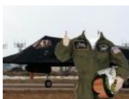
Анонимус пилотировал F-117