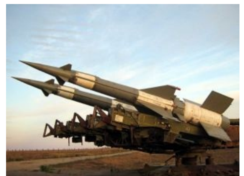
Проверенный советский инструмент для выпиливания летающих утиугов