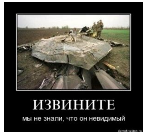
Обломки F-117. Того самого

Оная аппаратура позволяла вести огонь по целям вообще без использования РЛС — по визуальному контакту, то есть «куда глядя, туда ракета и летит», то есть при таком наведении зенитному комплексу абсолютно похуй, «стелс» самолет или не «стелс», что весьма доставляет. Ну, по крайней мере, этот способ доставил ракету в жопу «стосемнадцатому». Даже две ракеты. Минусы визуального наведения — далеко хуй стрельнешь (максимум километров на 10) и сильная зависимость от погоды (дождь, снег,