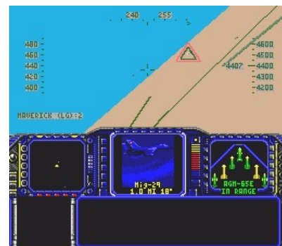
Тру олдфаги скажут, что это за игра

С началом открытого пиара F-117 он, естественно, начал звездить в унылых американских боевиках с маразматичными сюжетами. Первым был фильм «Филадельфийский эксперимент 2» (1992 г.), про то как фошсты изменили пространственно-временной континуум, украли F-117 с ядерной бомбой и выиграла WW2. На следующий год появился «Перехватчик», где стелс был похищен уже террористами. В 1995 сабж мелькнул в «Захват 2».