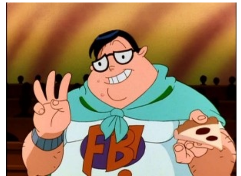
Фанбой из Фриказоида

Что касается творчества, то мужчины меньше всего пишут на романтические темы, но с удовольствием читают и фапают уже на готовый материал за авторством какой-нибудь фангёрлы. На счёт женщин существует мнение, что most fanfic writers are girls , но это вызывает парадокс на фоне того, что most writers are male , и уж тем более не вяжется с общеизвестным постулатом there are no girls on the Internet .