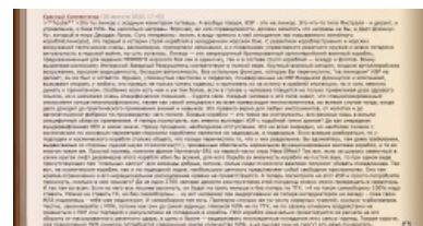
Подкованный эксперт каментит фанфик