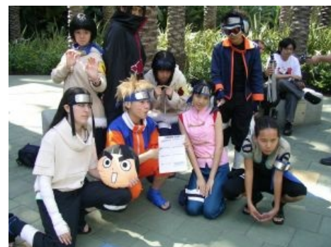
А это нарутарды

Невозможно переоценить положительную функцию феномена фэндома. Оказывается, сообщества фанатов усердно архивируют и каталогизируют информацию, разгребание которой нормальным людям противно или просто нахуй не сдалось. Благодаря им не забыты вещи, уже давно вышедшие из тиража, такие как старые фильмы или музыкальные жанры, ретроавто. Фанаты постоянно поддерживают их на плаву в интернете и IRL , сохраняя для себя и, между делом, для следующих поколений. В этом смысле, любого антиквара можно назвать фанатом старины, ибо всё там рано или поздно окажется. Кто-то ведь должен этим заниматься?