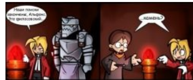
A challenger appears.