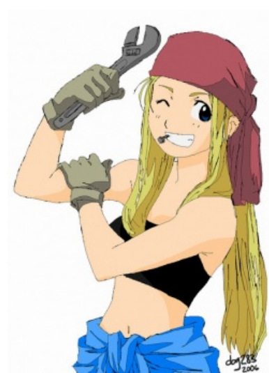
Местная багинька, куда ж без нее.

Концовка сериала неиллюзорно намекала на продолжение своим «I'll be back, Al!», в результате чего продолжение не заставило себя ждать — вскоре вышел полнометражный фильм «Стальной алхимик: Завоеватель Шамбалы». Лулзов значительно поубавили, а музыку поменяли полностью (фанаты так хотели услышать ту самую песню «Brothers»). Действие теперь происходит в нашем мире — в Веймарской Республике в 1920-е годы. Альфонс в своем мире обдумывает, как бы вернуть братика, в то время как Эд с своим новым корешем клеят реактивные двигатели и ракеты. Вскоре деятельностью Эда начинает интересоваться общество Туле (подконтрольное нацистам), а сам Эд знакомится с симпатичной цыганкой. Такой неоднозначный подход породил массу срачей и баттхёрта в /a/. Фильм люто ненавидим трюь фанатами. Снят он довольно средне, поэтому может вызвать серьезный интерес разве что у любителей истории нацизма, так как в нем неплохо передана атмосфера предвоенной Германии.