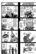
Отрывок из четырёхпанельного комикса, являющегося ОВАй ко второму сезону