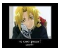
Изуми с супругом видят в тебе очередного гомункула!