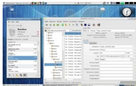
Рабочий стол в старой среде GNOME

Постоянно пытаются обосрать гномовщиков своими выкриками тем, что GNOME из-за своей простоты уныла чуть более, чем наполовину , и поэтому не является Ъ , а пользовательские приложения для текущего развития программного обеспечения написаны быдлокодерами и индусами , потому выглядят еще более уныло.