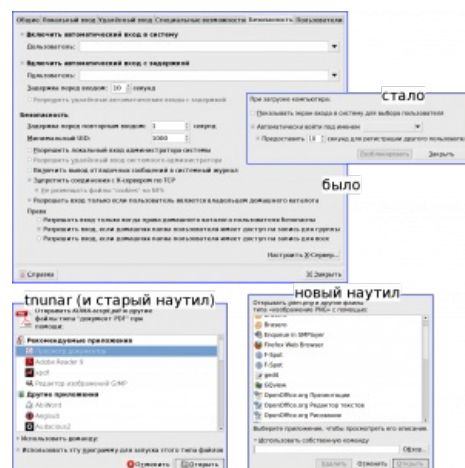
Наглядная демонстрация деградации гнома.

This "users are idiots, and are confused by functionality" mentality of GNOME is a disease. If you think your users are idiots, only idiots will use it. I don't use GNOME, because in striving to be simple, it has long since reached the point where it simply doesn't do what I need it to do.