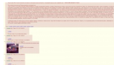
Яойщицы творят друг для друга

Ни для кого не секрет, что яойщиц тянет к геям, как пчел на мед, поэтому в га целый отряд жирух -яойщиц занят перманентным шликотом на прохладные истории /ga/тардов. В попытках разрядить обстановку они строчат простыни неправдоподобных историй, используя как образцы яойные фанфики по Наруто , созданные их лучшими подружками и соседками по парте из 6 "Б" класса.