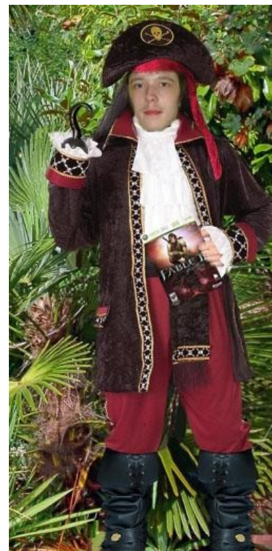
Гнусаве ператъшко — народное творчество.

Вспомним, что цель ГС — заработать. Тупо сказать на форуме, что образ продаем — не в стиле господина. Господин поместил в ту самую раздачу документ, в котором открыто сообщал, что на снятие этого образа были потрачены большие средства (видимо ему, или кому-то с гейм-торрент трекера пришлось купить игру). Далее следовала интересная формулировка: «GamerSuper совместно с новым битторрент-трекером собирается предоставить вам все эти игры в день выхода в таком же качестве, в котором вы видите FIFA 09. Для этого нам потребуется потратить невероятные средства и силы, чтобы совершенно бесплатно предоставить вам такие качественные релизы. Если вы не поможете нам материально, дальнейших релизов НЕ будет за неимением средств.» Другими словами, «Мы не будем выкладывать игры бесплатно». В раздаче FIFA09 содержалось видео, которое демонстрировало первые 15 минут русской версии игры Fable 2. Видео вскоре было выложено на Народ.диск , в описании файла значилось «Так как у нашей группы игра уже есть, ее можно приобрести по ICQ: 348—431-517». Тут следует вспомнить воровскую сущность «о, великого». Правильно — это была афера.