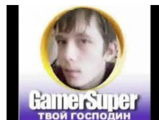
Официальный логотип геесупера

Известно, что некоторые релизы "ТВОЙ ГОСПОДИН" выпускались на пиратских дисках и продавались в ритейле. Далее представлен ряд историй, связанных с конкретными релизами фигуранта статьи.