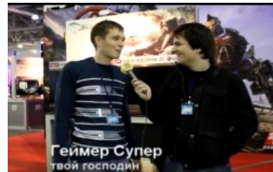
Мэддисон предлагает Гейсуперу обосраться на выставке

Подарите яйца, подарите яйца Подарите яйца, маленькие шмяйцы Яйцы-яйцы, подарите яйца Подарите яйца, маленькие шмяйцы.