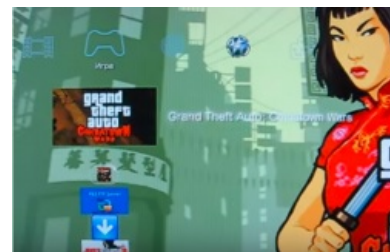
Унылый фэйк про запуск

Каково же было удивление аудитории, когда наш фигурант залил на