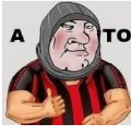
Грег? А то!