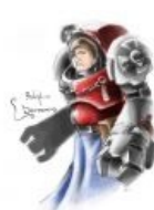
Адептус Бауманкус: Терминатор Грегус