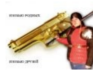
Убью родных, убью друзей