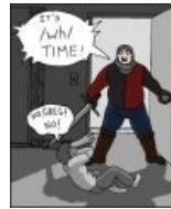
It's /wh/ time!