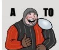
«А то» 2.0