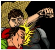
Иллюстрация из журнала «Ебенячьи человечки»