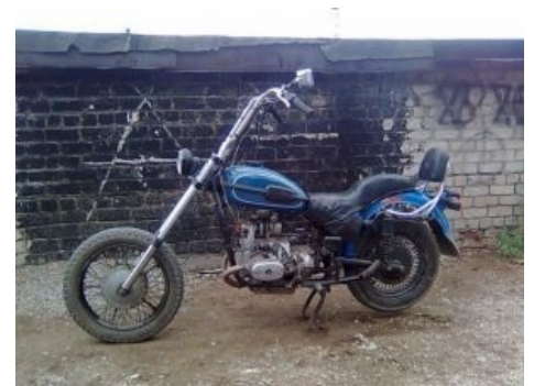
Типичная поделка харлидрочера