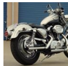
Sportster 1200, юбилейная версия