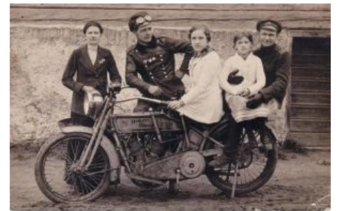
Харли на фоне георгиевского кавалера