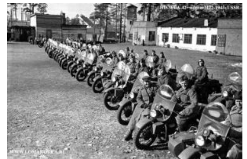
WLA в Советской армии