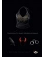
Немного БДСМа Готишно