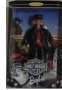
Да, и так тоже