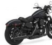
Сферический Спорти из Пала Мер и Весов, с классическим баком-«арахисом»

вспомнить, что Спорти являются гордыми носителями самого олдфажного и тру бного движка в нынешней харлеевской линейке — Evolution родом из 80-х, чем можно невозбранно троллировать любителей больших блестящих бигтвинов, которые уже докатились до жидкостного охлаждения и не сегодня-завтра получают DOHC.