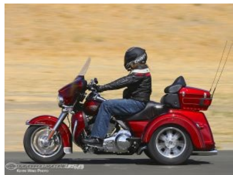
'09 Twin Cam (Tri Glide)