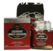
Пахни Хорлеем, будь мужыком!