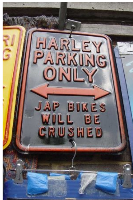
...ну и ниггерам тоже

Наиболее доставляющие формы заболевания традиционно процветают за пределами этой страны. Так, на мероприятиях НОГ регулярно проводятся развлечения в стиле «обоссы ненавистного джапа».