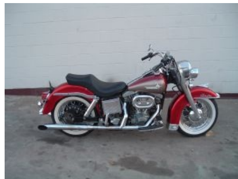
'77 Shovelhead (FLH)