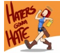
Ненавидят нимбы и наушники