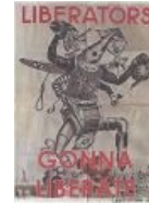
И её методы