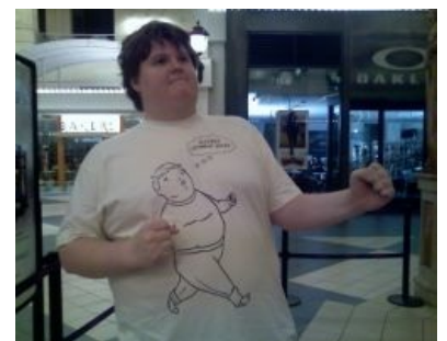
Толстый школьник IRL