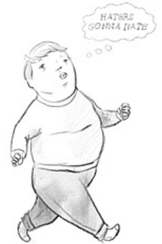
Та самая гифка

Haters gonna hate (рус. Ненавистники пускай ненавидят , маш. Ненавистники идут ненавидеть ) — универсальный ответ ОПа тред, автора поста или сообщения троллям, детекторам , критикам и прочим недовольным его креативом. В настоящее время, с развитием всякого рода социальных сетей, в 95% случаев, констатирует баттхёрт ОПа на критику в его адрес, что сближает это понятие, с другим не менее эпичным универсальным ответом — « сперва добейся! ». Однако, изначально был, сродни отечественному « мне насрать на твоё мнение », но более интеллигентен. Якобы давая понять, что автор изначально хотел привести хейтеров в их любимое состояние .