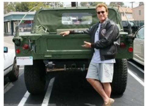
Humvee и Арни

Отделку салона довели до приличного уровня, поставили кондишн и музыку, 24-вольтовую электросхему (2 аккумулятора, соединенные последовательно) заменили на православные 12 вольт (хотя аккумуляторов оставили два, соединив их параллельно). На серьезные продажи никто не