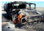
Подарок от аборигенов