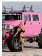
Фап фап фап