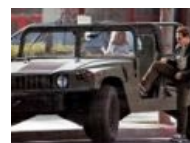
Большое тянется к большому