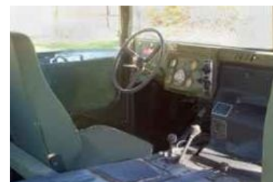
Недружелюбный интерфейс Humvee