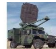
С СВЧ-грилем для равномерного прожаривания митингующих