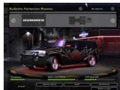
Школота тешится, Алсо Надмозг во все поля.