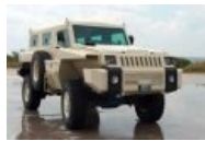
Расовый южно-африканский закос под Хамви