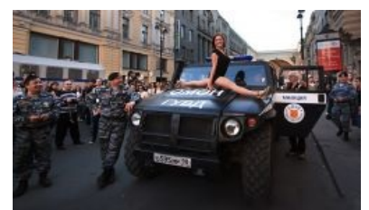
Сиськи любят ОМОН и Тигр.