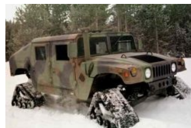
Версия для блицкрига по сибери.