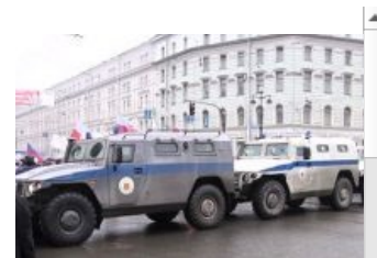
Передвижной тигро-забор на колесах.