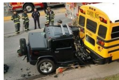
Хаммер vs школьный автобус