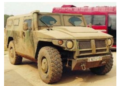
Российский ГАЗ-2330 «Тигр»

Получившаяся машина оказалась несколько отличным от оригинала класса, но русские не растерялись и заявили, что так и было задумано, дабы грузоподъемность и вместимость были приличными для армейской машины. Мог бы получиться эпик вин, если бы при весе вдвое больше, чем у Хаммера, у производителя было бы хоть какое-то желание создать что-то с заделом на будущее и вдобавок имелся бы в наличии подходящий