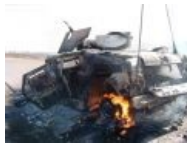
Тоже М 1114