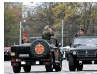
Гламурные Парадные кабриолеты «Тигр» — поцреоты

Что характерно, ГАЗ и разные поцреоты постоянно сравнивают «Тигр» с Хаммером или УАЗ-469, однако открыто сравниваться с такими признанными лидерами рынка, как ЮАР-овские RG-31 и RG-32 арзамасские гении не хотят, даже заочно.