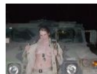
Ok, you may stay