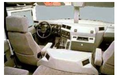
Userfriendly интерфейс Hummer H1