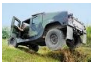
Диагональное вывешивание ему не страшно.