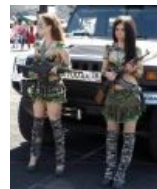
Аж джва бронелифчика прилагаются