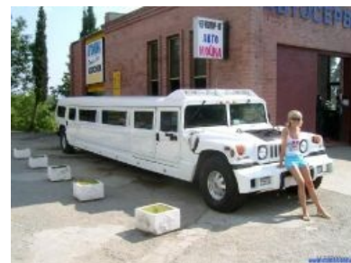
Длиннохаммер различных Киркоровых.