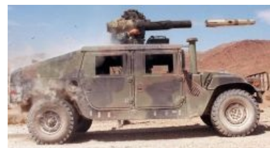
Мечта любого американца.

Приобретением данных девайсов озаботились многие звезды Голливуда и различные прославленные качки, и просто обремененные деньгами быдло. Не последнюю в этом роль сыграл и Арни « The Governator » Шварценеггер,