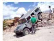
Достоинства минимальных свесов