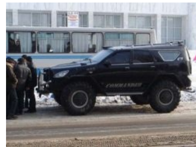
Украинский «ВЕПР» (рус. Вепрь)

Китайцы не отстают. Со свойственной им манерой все невозбранно пиздить скопировали Хамви чуть более, чем полностью, изменив лишь фары и решетку радиатора и поставили его на вооружение под именем EQ2050 . Решетку радиатора с семью вертикальными прорезями решили поменять из-за былинного срача между «AM» и «Chrysler», который распизделся, что якобы семь вертикальных дырок — патентованное решение для «Jeep Wrangler». Данную машинку китайцы в припадке дружбы подарили белорусам в количестве двух десятков штук, так что теперь их можно увидеть в Минске на всех парадах под гордым именем « Богатырь ». Помимо китайцев, любовью к копипасте отметились и некоторые другие вполне себе цивилизованные страны мира, такие как Испания, Франция и Швейцария .