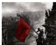
Внезапно, срыв покровов