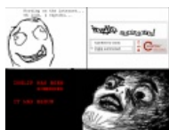
С этого все и началось