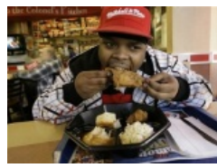
Чистой воды стереотип