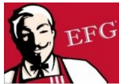
Eric Fail Guy