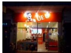
И это тоже не фотошоп