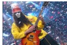
Пиндосский гитараст Buckethead. Поди пойми, противник или сторонник