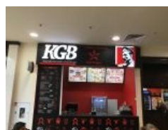
IRL. ВНЕЗАПНО, не фотошоп