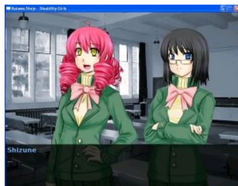
Самые ранние концепты