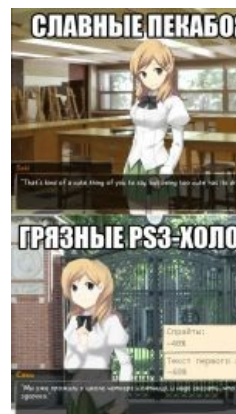
Шуточки про PC и PS3 дошли до Катавы