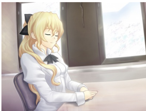
Как на плакате

Еще у Лилли есть старшая сестра — реверс-трап по имени Акира, которая для своего чопорного вида имеет довольно раздолбайский характер. Она училась в том же пансионе, но долго не продержалась . Кроме того, вся арка Лилли тесно переплетается с аркой Ханако, для которой Лилли — лучшая (и единственная) подруга, поэтому некоторые события можно встретить в разной трактовке и там, и там. Из прочих взаимоотношений следует отметить странную неприязнь между Лилли и Шизуне, которая выливается в циничные насмешки и критику со стороны Шизуне и спокойное парирование со стороны Лилли (разрыв шаблона вызывает то, что общаться друг с другом они неспособны физически; налаживать хоть какую-то связь им помогает Миша, которая таких ситуаций очень не любит и не знает, чью сторону принимать). А еще Лилли ( спойлер : быстро подсаживается на все подряд и не слезает, будь то чай, спиртное или секс).