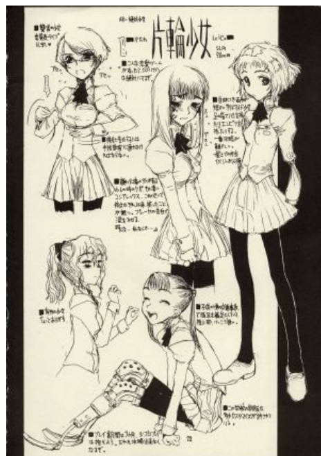
Та самая страница

Двое безработных играют в сабж (Spoiler alert)