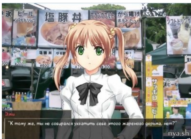
Старый скрин из первой главы хранит следы

А эта уже не комсомолка, но спортсменка еще та — при том, что она безногая , на протезах бегают так, что мама не горюй. Ноги она потеряла в автокатастрофе ( спойлер : Тогда же погиб и ее отец), но очень быстро реабилитировалась, научилась ходить на протезах и, даже не подумав унывать, вступила в беговую команду Ямаку. Надо сказать, что бегают она просто великолепно, и что бег настолько её увлекает, что в процессе она даже впадает в ту самую знаменитую зону , в которой находятся все, кто увлеченно что-то делает. Много ругается, яростно пропагандирует ЗОЖ и вообще ведет себя развязно — да, и в этом плане тоже ( спойлер : парень у нее уже был, и есть намеки, что она уже отнюдь не девственница). Вечно дуется на всех, кого хочет разжалобить — причем всегда с победным результатом.