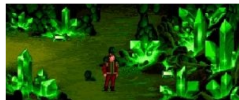
Скриншот из игры Legend of Kyrandia: Брэндон и Тибериум. На принцев радиация не действует.

Малколм ( Malcolm ) — антагонист первой и, по совместительству, ГГ третьей части. Тролль всея Кирандии, одет в шутовской костюм, мечтает узурпировать власть в стране just for lulz . При этом не гнушается и убийствами (но с этим моментом не всё так просто ).