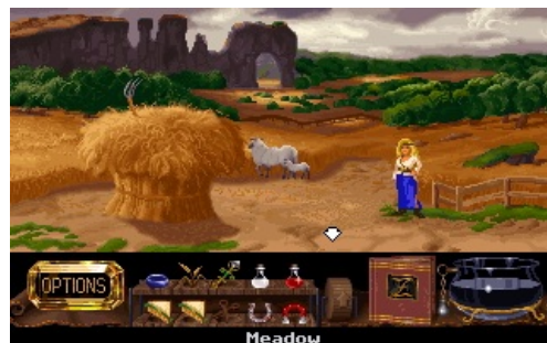
Занция и пейзаж.

Все три игры серии имели чрезвычайно простое управление и интерфейс. Использовалась только левая кнопка мыши. Перемещение по миру, разговоры со всякими встречными товарищами и все действия с предметами осуществлялись путём тыканья мышью в соответствующие места игровых локаций и инвентаря. Это было возможным, в частности, благодаря тому, что инвентарь располагался прямо на виду, под игровым экраном. (Сам игровой экран от этого, конечно, несколько терял в размерах.) Первые две части имели в сюжете по одному убер-эпизоду каждая (для прохождения обоих этих эпизодов требовалось многократное повторение рутинных действий; подробности ниже).