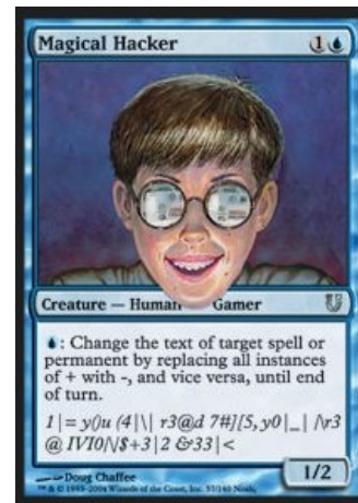
Пример из «МТГ».