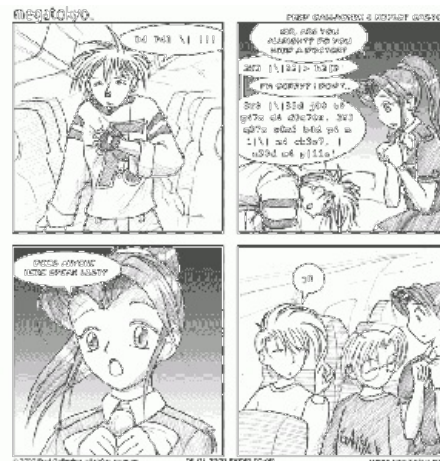
«Кто-нибудь говорит на лит-спике?»