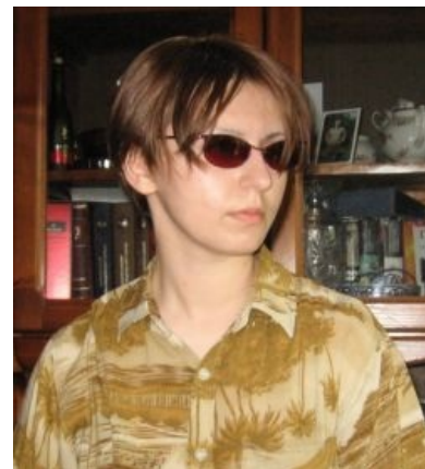
Это не трап. Это реверс-трап

««А кто это вообще такая? Я хз» — сказал нам г-н Киваму в своём эксклюзивном интервью. »