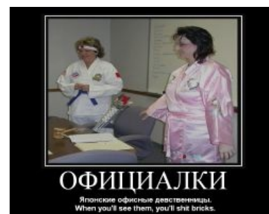
Берегите свой пупер