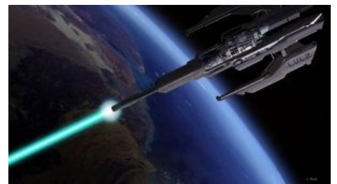
LOIC в работе

Aka High Orbit Ion Cannon. Неведомая ёбаная хуйня, появившаяся в декабре 2010. Позлее LOIC`а, позволяет бомбардировать одновременно до 256 сайтов. В отличие от предшественницы, которая закидывает цель мусорными пакетами, HOIC использует HTTP флуд , в том числе и POST/GET запросы, заставляя сервер срать