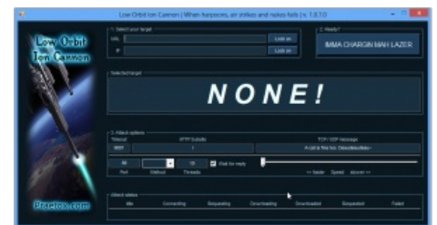
Сабж как он есть