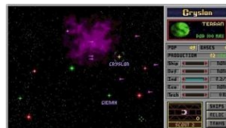
Первая часть. Играли, и добавки просили