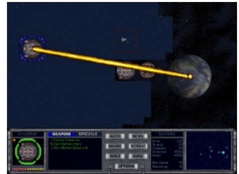
Stellar Converter. Почувствуй себя Дартом Вейдером