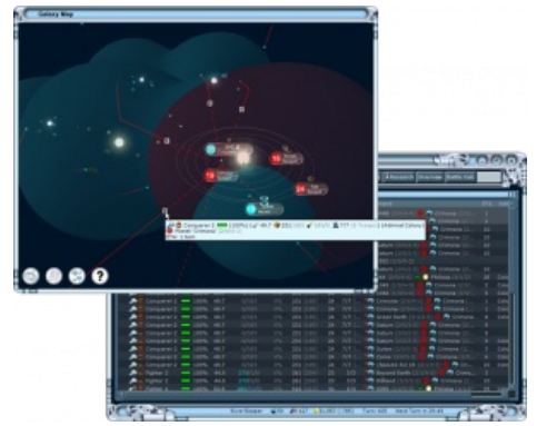
Винрарный последователь MOO2