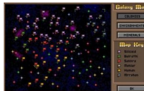
А генерал, зажавши ластик, склонился над военной картой...