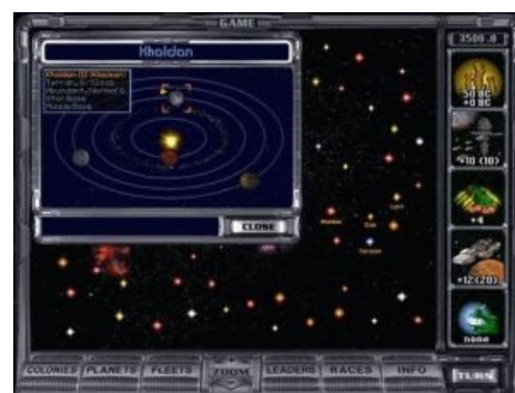
Тёплый, ламповый МоО2

Игровой процесс (мы говорим и будем говорить про первые две части) охуевающе аддиктивен. Неосторожно сев перед сном на пару ходов, можно очнуться от игры лишь от стука утренних