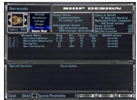
МоО2. Конструктор кораблей

Основная проблема третьей части была изложена выше. На первую и вторую тоже есть нарекания, главное из которых — небольшой размер карты. Даже на максимальном размере галактики все очень быстро вцепляются друг другу в глотку, и всякие дипломатические