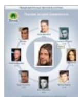
Роб, он лучший