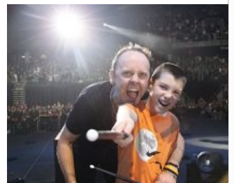
Педоларс в действии