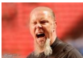
20 лет спустя