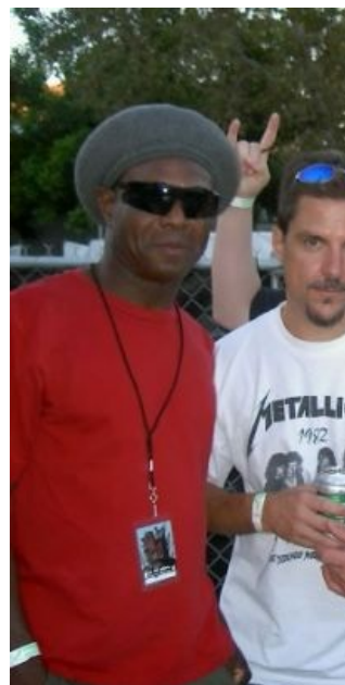
Чёрный властелин с басистом