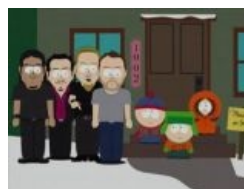
Саус Парк Christian Rock Hard