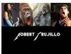
Нам кагбэ намекают