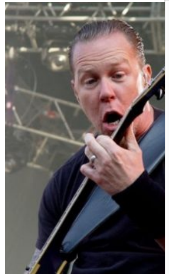
Хэтфилд не понел

Клифф Бёртон — басист, дохлый герой , любитель годной травки и просто хороший человек. С детства учился играть на басу, и даже в Метле занимался ежедневно по 6 часов. Единственный участник в группе который шарил в музыке (ноты, построение аккордов и т. п.), что ему и позволило научить остальных участников всем этим нюансам. Это