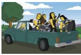
Симпсоны s18 e1