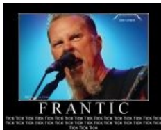
Мотиватор по теме