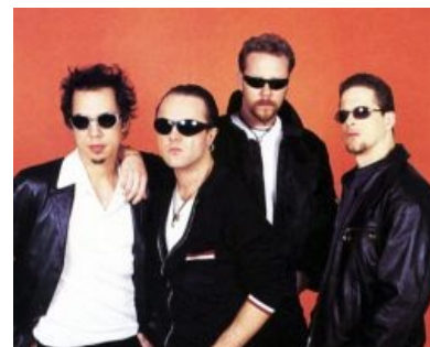
Как бе постриглась

Где-то через пару лет Metallica меняет имидж. Совсем. На Вудстоке иконы металла предстают в хрен пойми какой одежде и с модными причёсками, благодаря чему лишаются существенной доли своих фанатов, сочинивших впоследствии присказку «Рок умер, когда подстриглась „Metallica“». Внешность внешностью, а музыка с каждым альбомом становилась всё более нетруЪшной. Причиной тому стали говнари из Сиэтла , анально оккупировавшие всевозможные радиостанции своими песнями про дерьмовую жизнь, непонимание мира и прочую хуйту, от которой тянуло блевать настоящих мужиков и труЪ-металлистов. В результате многие обрыганы лишились своей основной аудитории , пафосные гей-металлисты успешно совершили обмаз, а оставшиеся в живых трэшеры стали бороться за место под солнцем, начав подстраиваться под новые реалии. Одни начали клепать ковры, другие — эксперименты с мазафакой (Anthrax), хард-роком и хэви-металом (Megadeth), а третьи (Pantera) — играть дико популярный грув-метал (это такой замедленный трэш), ставший годной альтернативой гранжа. Не прошла мимо этих реалий и Метеллица, выпустив откровенно унылые альбомы Load и ReLoad, так и разящие попсой за километры. Затем последовал сборник ковров , а под конец тысячелетия доводит своё творчество до абсурда, выступив с симфоническим оркестром, и перестает доставлять музыкой. Выступление с оркестром вошло в альбом S&M, расшифровка которого породила немало лулзов, хотя всего навсего означала «Симфонический