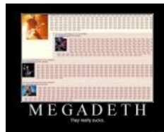
Megadeth — говно