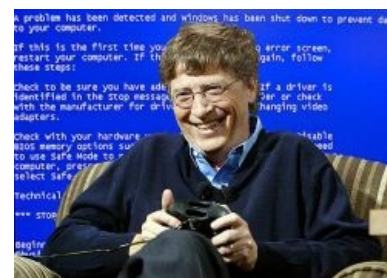
Знаменитый Билли на фоне знаменитого экрана