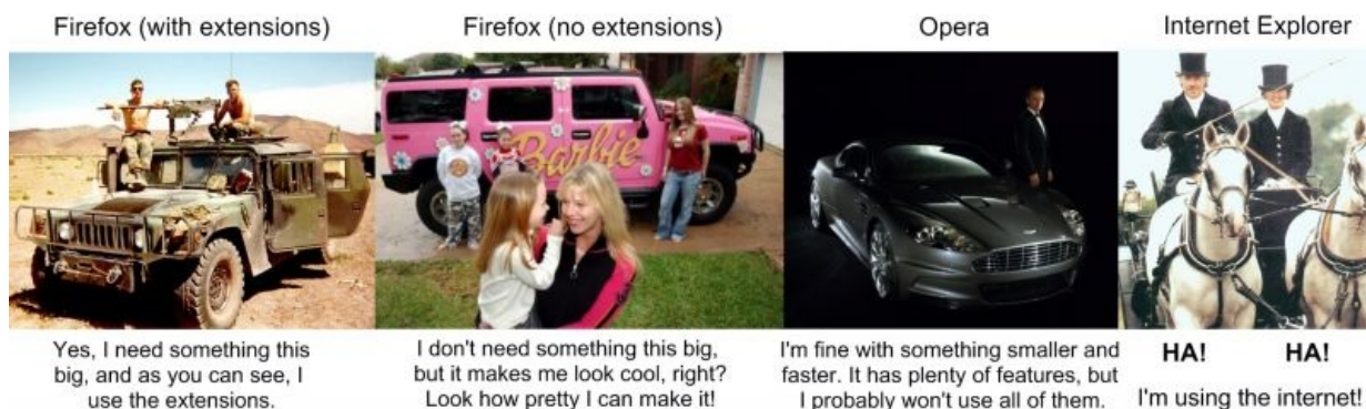
Объективное сравнение самых популярных браузеров (2007 год)