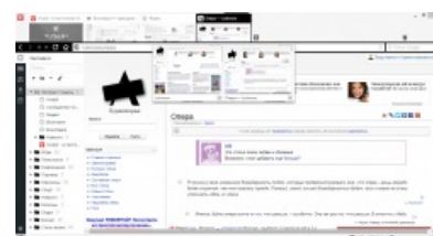
Vivaldi — реинкарнация Opera