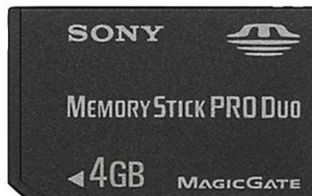
ОригиналЪ крупным планом. Скорость записи — до 20Mb/c. Все надписи на карте являются чистой правдой.