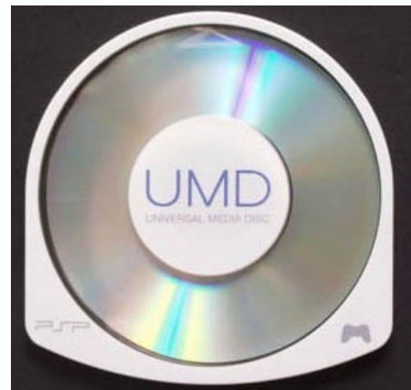
UMD (Universal Media Disc).

Текущая версия custom-прошивки от Dark Alex'a — 5.00 M33-6. А текущая версия не от Dark Alex'a — 5.50 GEN-D3. Эта прошивка написана французской командой Gen. Весьма вероятно, что последователи Dark Alex'a ограбили корованы и использовали материалы из 5.03 GEN-A для запуска своей прошивки на PSP-3000. На прошивке 5.50 Prometheus идут игры с 6.20 без заплаток.