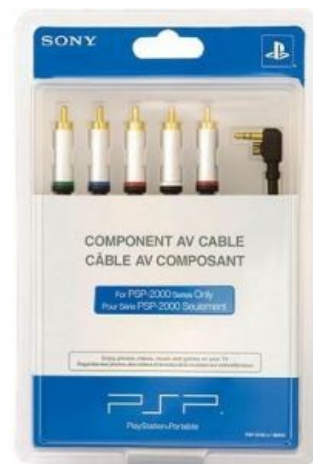
Компонентный шнур для вывода изображения на телевизор.

Ещё появился видеовыход для подключения консоли к телевизору, но поиграть с помощью него можно только если в наличии имеются: компонентный шнур (пять «тюльпанов»), который вы можете приобрести отдельно, а также телевизор с компонентным входом и поддержкой прогрессивной развёртки . Как правило, это LCD и плазмы, реже кинескопные. Существуют также композитные шнуры, то есть для обычных теликов (три «тюльпана»), НО, поскольку по ним передаётся сигнал только с чересстрочной развёрткой — то счастливый обладатель одного сможет разве что намотать его себе на МПХ. Ах да, ещё сможет лазить по менюхе и смотреть видео, потому что Slim выдаёт игры в режиме прогрессивной развёртки. Даже если вы потратитесь на компонентный шнур и у вас есть телевизор, к которому он подходит, то качество картинки станет большим разочарованием , потому что графика, которая рассчитана на экранчик с разрешением 480×272, в телевизоре с разрешением 1080р будет выглядеть как УГ. В общем, это ваше подключение карманной консоли к телевизору придумано исключительно для извлечения лулз дополнительного профита из карманов ценителей аппаратуры будущего .