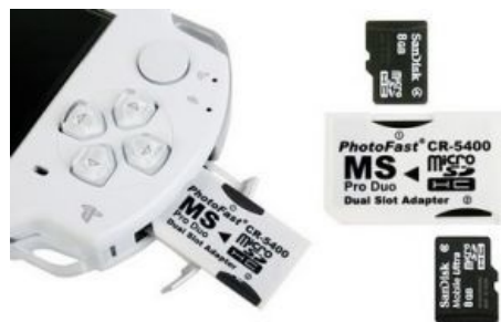
Вариант получения MemoryStick-а на 16Gb из двух MicroSD по 8 Gb.

В общем, вышеописанной половой еблей с подделками занимаются задроты-нищоброты, остальные же,