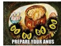
Prepare your anus, Winnie