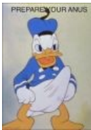
Donald Duck не отстаёт