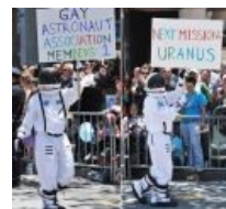
Gay astronaut not from outer space