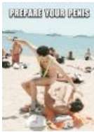
Борат делает это не так.