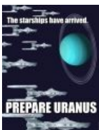
Stargazer'ы готовят Уран