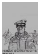
Уберите акул с пляжей