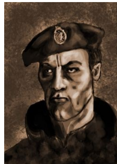
Его еще и рисуют

Всемирную известность солдатскому ансамблю принес ролик «RAMBO SERBIA», появившийся в 2010 году и содержащий довольно заводную мелодию Balkan Beat — Serbian Mix (оно же DJ Zeki — Club Wedding (Serbian Remix) ). Особое внимание привлекло описание к видео, где автор посылал лютые лучи обожания врагам народа и их неполноценной расе: