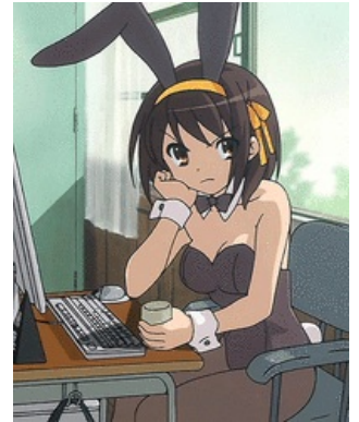
Харухи косплеит Радована Караджича со стаканом