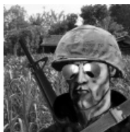
Born to REMOVE