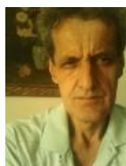
Он же в 2016 году. Жив, отсидел 5 лет, перебрался в Черногорию, чуть ли не молится на Путина