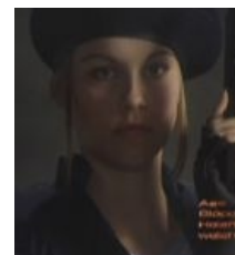
Джилл из того же FMV ролика