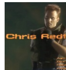
Крис из FMV ролика на PSX