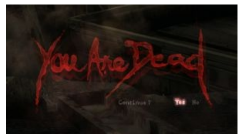
Goodnight, sweet prince