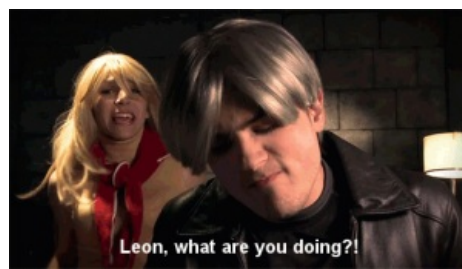
Школоте не понять