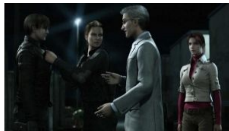
Сегодня у кого-то будет вирус