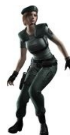
В Римейке Джилл страдает недоеданием