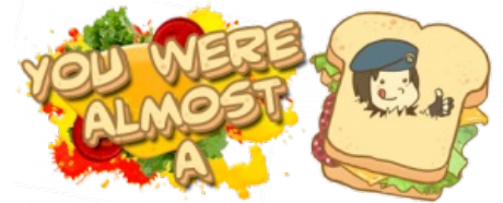
Один из многих фан-артов

Mega64: Resident Evil 4 Знаменитый ролик троллинга прохожих