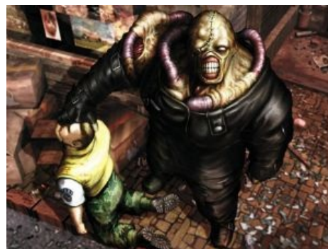
Немезис смотрит на тебя, как на следующего