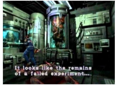
Из лаборатории мер и весов

Один из самых знаменитых мемов серии. Родом из первой части, где и так хреново написанный и переведённый сценарий попытались разбавить смущенной шуткой. Произносится Барри Бёртоном, когда тот спасает Джилл из ловушки с комнатой-прессом : «Ты чуть было не превратилась в Джилл сэндвич».