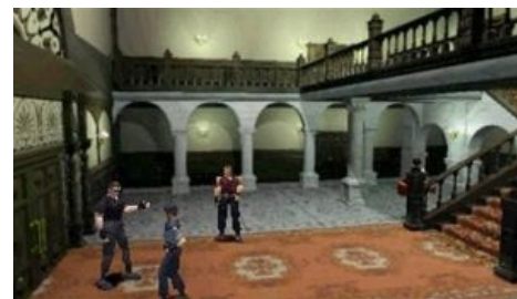
What a mansion

отправленная рота благополучно пропадает и ей вслед тут же шлют вторую, которую прямо на месте высадки атакуют мутировавшие собаки. Отряд успевает спрятаться в близлежащем готичном особняке. Так начинается самая первая игра серии — « Resident Evil », выпущенная в далёком 1996 году на PlayStation. По тем временам игра отличалась кошерной графикой, роликами с профессиональными (почти) актёрами и шикарной мрачной атмосферой. Выбрать можно было одного из двух персонажей: brutального мужика Криса Рэдфилда или фапабельную бабу Джилл Валентайн, прохождение за которых почти не различалось. Джилл, например, имела немного меньше здоровья, больше места в инвентаре и получала помощь от Барри. Крису вместо помощи от Барри приходилось оказывать оную Ребекке. На взаимодействиях альтер-эго и второстепенных персонажей и строились сюжетные ответвления. Ну и концовки отличались самую малость. А ещё там можно было невозбранно обезглавить приторможенного упыря или отстрелить ему ноги и, нарезая круги вокруг ползающего, прикончить ножом, что для середины 90-х было очень ново и донельзя жестоко. Именно в этой части был заложен типичный геймплей серии.