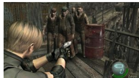
Ага, вот эти ребята

В 2005 году Капком выпустили переломную для игросериала часть, породившую массу срачей — «Resident Evil 4» . Во-первых — изначально игра вышла на Gamescube, заставив люто-бешено негодовать владельцев PS2. Во-вторых — геймплей изменился чуть меньше, чем целиком. Сами авторы игры обозначили жанр как «Survival Action». Ламповый Раккун Сити заменили на мухосранскую деревеньку в Европе, вирусы заменили паразиты «Las Plagas» , тупых и медленных зомби — тупые и быстрые колхозники, а бои с боссами строились по принципу «стреляй в уязвимые места, бегай от инсталлов, добивай ножом» . Самым интересным нововведением стал «расширяемый» кейс-инвентарь, позволявший заведовать всем нажитым хозяйством игрока, как ему заблагорассудится и прокачиваемый до баула 80 уровня. Позже игру таки портировали на PS2, но, поскольку она потенциально несколько слабее Геймкуба, графику слегка урезали, а заставки на движке игры и вовсе заменили на видеоролики из кубовской версии. Для утешения в PS2-версии были добавлены новые миссии. Пипл схавал и не поперхнулся, и появился новый вид СпецОлимпиады — PS2 vs GC версия. Порт на PC появился аж в 2007 году и был, в лучших традициях, ректально-ориентированным (одно только прицеливание на клавиатуре чего стоило). Но в 2014 Сарсом таки разродилась на HD-версию с нормальным управлением.