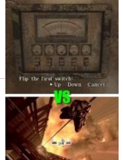
Пазлы в старых и новых частях