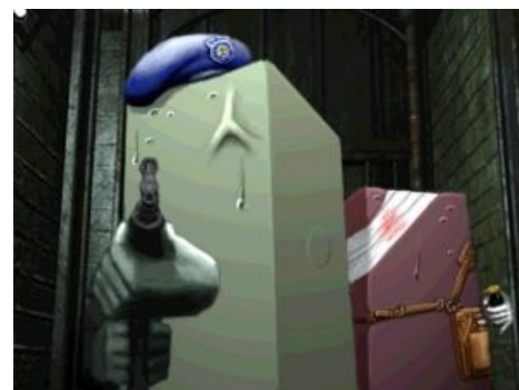
Тофу смотрит на тебя, как на говно

Третья часть эпопеи, под названием « Resident Evil 3: Nemesis », вышла в 1999, пока железо было ещё горячо, на закате PSX. После довольно непростого периода разработки Сарсом явила миру революционные изменения , напичкав своё детище всяческими вкусностями, среди которых были и вины и серенькое УГ. Теперь изначально можно было играть только за одного персонажа: довольно легкомысленно одетую Джилл. Но зато в распоряжении геймера находился почти весь Енотград! Зомби стали куда многочисленнее и шустрее, а всё оружие из предыдущих частей (с апгрейдами, да) можно было выбить или найти на улице. Беготни определённо прибавилось, головоломки стали похожи на первую часть, но с удобством второй. А ещё присутствовал крафт патронов, что резко развязывало руки задротам. Нелинейность присутствует в виде периодически возникающего выбора «сражаться или бежать», влияющего как на геймплей, так и на концовку. Игра заканчивается локальным экстерминатусом всего 100-тысячного Раккун Сити. После финальных титров, в качестве бонуса, становится доступна винрарная мини-игра «Наёмники», ставшая неотъемлемой частью всех последующих частей.