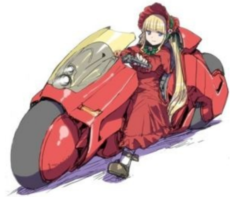
Шинку на машинке