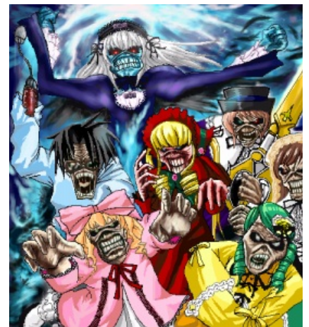
А так лучше?