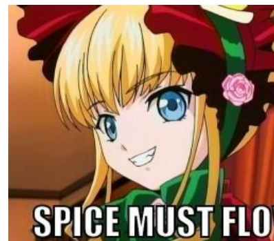
Шпайш машт флоу