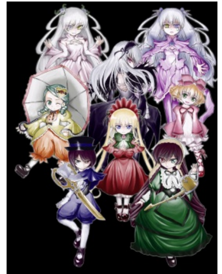
А вот и они

Сюжет аниме, как и характеры персонажей, очень сильно отклоняется от манги, хотя первый эпизод у них почти один-в-один. Во втором сезоне аниме и вовсе от манги остались только оболочки кукол, ибо характеры и сюжет полностью перекроили. Апофеозом этого цирка стал приквел к аниме Rozen Maiden: Overture , состоящий из двух серий. Крайне рекомендуется прочтение манги, прежде чем ввязываться в споры и поливать нечистотами третий сезон 2013 года, который является дословной экранизацией первой половины тейлов с очень кратким пересказом основной манги.