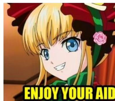
Enjoy your AIDS