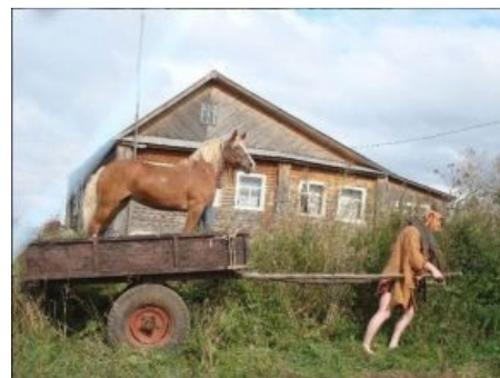
Казалось бы, причем тут Ксюша ?

— А я тогда присягу принимать не буду! — Эх, дружок, молод ты... Не ты выбираешь присягу, а присяга выбирает тебя! Прапорщик, запишите эти простые, но, в то же время, великие слова.