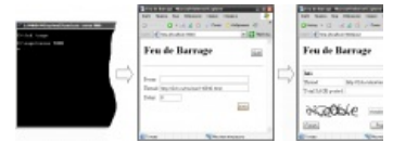
Feu de Barrage.

Cool Story Pro 9000 sage machine ( маш. Прохладный История Pro 9000 мудрец машины ) — отечественная разработка, используется для сагания тредов на Тирече. Автоматически забивает поле «сообщение» большим (при отсутствии пикрилейтед — разным) количеством «Ключевых Слов» (например, классическое «сажа»), для удобства отображает сразу несколько капч, можно также указать программе папку, из которой она будет брать рандомный пикрилейтед, что очень удобно для сагания ниграми или говном.