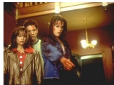
GAME OVER: Goodnight, sweet maniac

в фильмах ужасов всегда так! Каждый фильм заканчивается феерическим срывом покровов с убийцы (причём делается это всегда добровольно с его стороны), получасовым монологом маньяка и финал баттлом с Сидни. Для убийцы, естественно, всё заканчивается эпик фэйлом . ВНЕЗАПНО оживший на последних секундах маньяк и его эффектное добивание прилагаются.