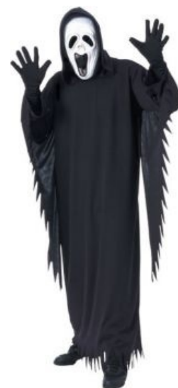
Посоны, не бойтесь, я сегодня в хорошем настроении

По своей структуре «Крик», на первый взгляд, как и пародируемые им фильмы, является типичным ужасиком без особых изысков. Тем не менее, он не канул в Лету с течением времени, как, например, «Я знаю, что вы сделали прошлым летом» [1] , и тому есть причины: