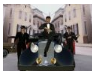
Потому что мы бригада.