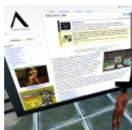
Луркоебы в наличии.