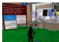
Самка в поиске.