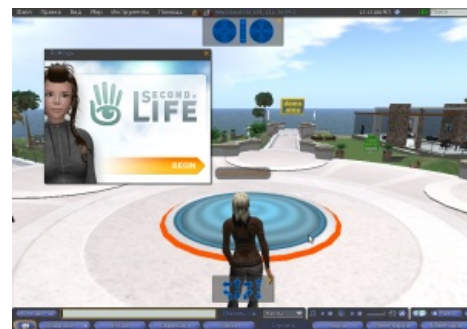
Гламурный SL такой гламурный. Стартовая зона.

Большое количество всех этих адептов анонимной сл-ебли, виртуальных отношений и прочих прелестей жизни идеальным альтер-эго в обязательном порядке заводят себе внутриигровые магазины (или видимость деятельности), которые обычно приносят либо копейки, либо вообще ничего не приносят. Цель одна — оправдание проведенного у монитора времени, получение небольшого профита на покупки модных свистелок, перделок и возможность заявить всем: « Вы все пидорасы , а для меня всё это не более чем заработок». Отсюда возникает видимость повсеместной коммерческой деятельности.