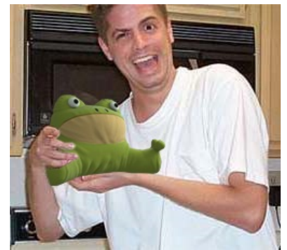
Лоутэкс с предвестником мема GET OUT

Завсегдатаями делаются обзоры на недавно просмотренную порнуху, а читатели обзоров обсирают их в комментах, но на самом деле немедленно скачивают и дробчат. Драмматика гарантирует это.