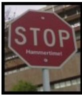
На знаке (каноничный вариант)

Пытливый американский народ придумал уйму примеров применений слогану. Чаще всего, однако, эти примеры связаны с красными знаками «Стоп».