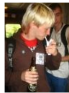
sXe такие sXe!