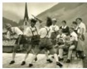
Предки современных sXe