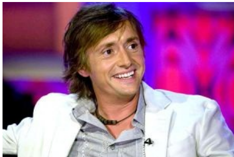
Richard «Hamster» Hammond и его белоснежная улыбка

11 марта 2015 года люто бешено вёбал продюсеру за то, что ему не принесли покушать после съёмок, и был отстранён от эфира. Хаммонд и Мэй отказались вести передачу без него. Такие дела . 25 марта 2015 Кларксон был Официально™ выгнан ссаными тряпками с канала BBC и передачи Top Gear, после чего получил работу на канале Amazon и, вместе с Хаммондом и Мэем, создал новое шоу The Grand Tour, которое, в отличие от перезапущенного и скатившегося в УГ Топ Гира, большинству оказалось по нраву. В настоящее время также дибровствует в английской версии "Кто хочет стать миллионером?"