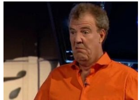
Кларксон смотрит на Ладу .

Top Gear drops piano on Morris Marina! (HQ)