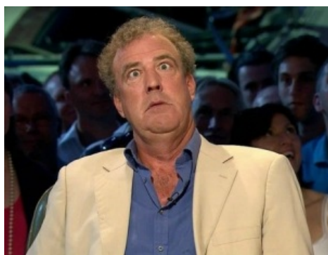
Сэр Джереми в студии.

Весьма доставляет , но часто вызывает ненависть у ФГМнутой части населения Островов. Один из эпизодов, вызвавший бурление говн — описание типичного дня водителя грузовика: «Переключить передачу, переключить передачу, посмотреть в зеркало заднего вида, переключить передачу, убить проститутку, переключить передачу...». Фраза была вброшена как раз в тот момент, когда шло расследование дела об убийстве нескольких придорожных бабочек маньяком-дальнобойщиком. Извинения за эту фразу так и не были принесены, более того, Кларксон только продолжил острить на эту тему. Он вообще любит политкорректность.