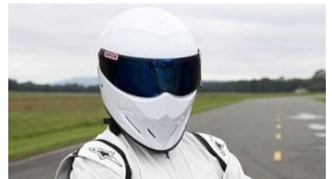
Стиг смотрит на тебя как на стритсракера.

водительском костюме и шлеме. Является «приручённым гонщиком» программы — тестирует крутые тачки на скорость прохождения трассы, из чего впоследствии составляется рейтинг крутости этих самых тачек. С ним связан небольшой набор традиционных шуток передачи: мелодии, которые слушает Стиг во время прохождения круга, его абсолютная молчаливость при обращении к нему окружающих людей, а также то, как его представляют ведущие. Авторы не прочь пошутить на саму тему анонимности Стига, а потому для передач в отдалённых частях света могут выставить местного «родственника Стига», например, толстого Роско Пи Стига в южных штатах Пиндостана или загорелого кузена Стига в Ботсване. В одной из серий помимо этого был замечен племянник Вега-Стиг, просто обожающий экологически чистые автомобили (комбинезон и шлем ярко-зеленого цвета в наличии). Был удачно выпилен тройцей ведущих собственноручно созданной машиной с отвалившейся выхлопной трубой в той же серии.