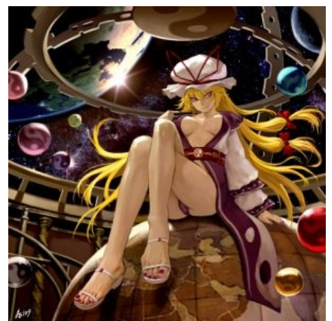
Юкари, её довление и нерезиновая

Чит. способность 2: В Curiosities of Lotus Asia Юкари невозбранно сделала себя «готик лолитой », « обоснуем » выступает заявление про сдерживание своей силы. А разгадка одна: только в этой форме