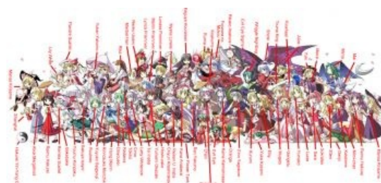
Altogether ранний (TH 01-08)