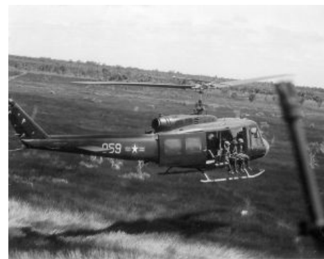
Каноничный вариант. Таким он был во Вьетнаме.

Применялся вертолёт в нескольких вариантах: