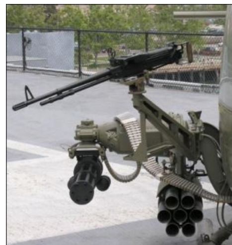
Бортовые устройства ганшипа для проведения экстерминатуса. Рэмбо подавился слюной от зависти

Современный Хью УН-1У просто наполнен разнообразными свистелками и перделками, преимущественно радиоэлектронного характера. Как-то: детекторы лазерного, радиолокационного облучения, система оповещения о ракетной атаке, система запуска ложных тепловых целей и ещё куча всего. Для того, чтоб всё это влезло, даже пришлось сделать вставку между кабиной пилотов и грузовым отсеком . Все жизненно важные системы дублированы и защищены. Лопастя несущего винта выдерживают попадания из 23-мм пушки. Кроме того, кабина пилотов полностью оборудована ЖК дисплеями (full-glass cockpit) и навороченными шлемами для пилотов: ЖК дисплей, радио, органайзер, поддержка GPRS, bluetooth, встроенная камера 2 Мегапикселя, Змейка и Тетрис. Так что, современный Хью — это не хухры-мухры. Выпилить не так просто, как когда-то.