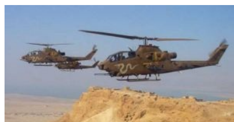
Кобры израильтян летят