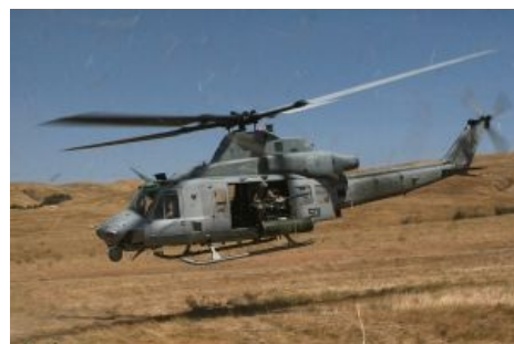
Таким он стал сейчас.